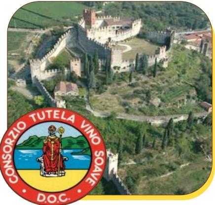
Sopra, il castello di Soave, il simbolo di tutta l'area che dà il nome al vino Soave

Nel 1998 arrivava la Docg per il Recioto di Soave (D.M. 7 maggio 1998), alla quale si affiancava nel 2001 la Docg per il Soave Superiore (D.M. 29 ottobre 2001).